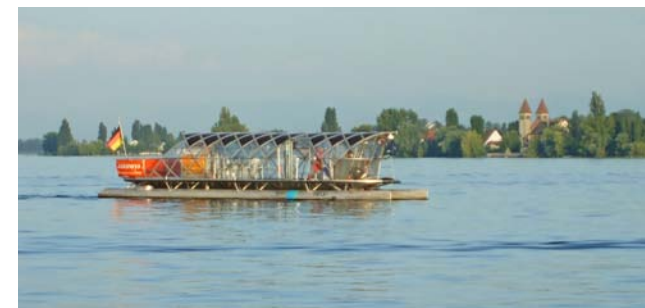
Die HELIO vor dem Weltkulturerbe Reichenau.