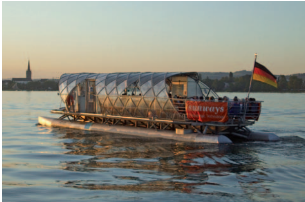
Die HELIO in Abendstimmung vor Radolfzell.