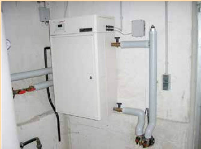
Platzsparend: die Hausübergabestation ersetzt Ihre Heizungsanlage.

Für den Wärmekunden stellt die Nahwärme eine komfortable Lösung dar. Er spart die Investition in einen neuen Heizkessel sowie Wartung und Reparatur. Er braucht sich nicht um den Brennstoffeinkauf zu kümmern und hat mehr Platz im Keller.