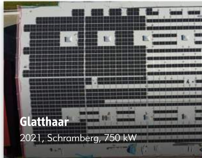
Glatthaar 2021, Schramberg, 750 kW