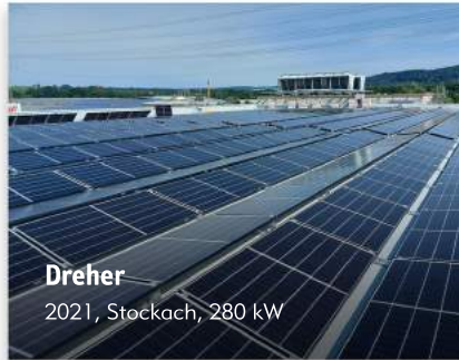
Dreher 2021, Stockach, 280 kW