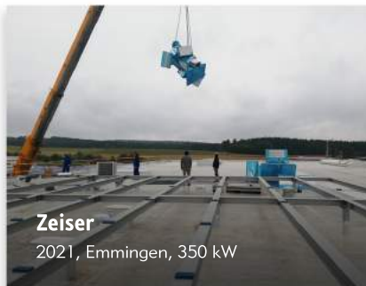
Zeiser 2021, Emmingen, 350 kW