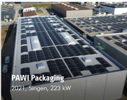
PAWI Packaging 2021, Singen, 223 kW