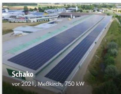
Schako vor 2021, Meßkirch, 750 kW