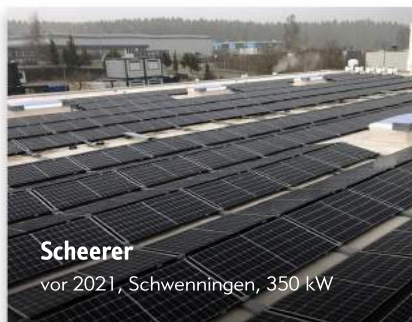
Scheerer vor 2021, Schwenningen, 350 kW