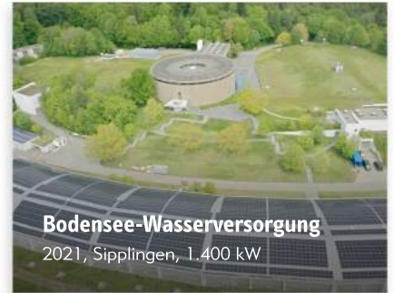
Bodensee-Wasserversorgung 2021, Sipplingen, 1.400 kW