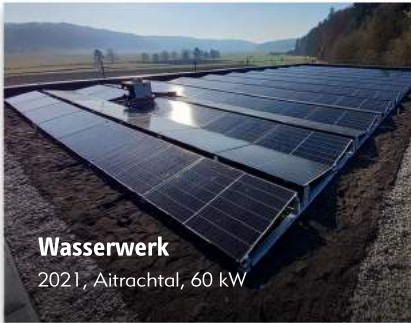
Wasserwerk 2021, Aitrachtal, 60 kW