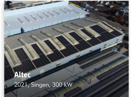
Altec 2021, Singen, 300 kW