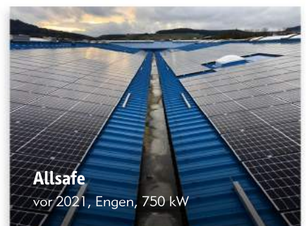
Allsafe vor 2021, Engen, 750 kW