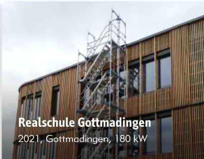
Realschule Gottmadingen 2021, Gottmadingen, 180 kW