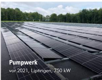
Pumpwerk vor 2021, Liptingen, 750 kW