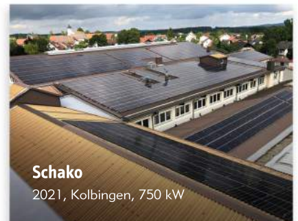
Schako 2021, Kolbingen, 750 kW