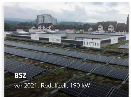
BSZ vor 2021, Radolfzell, 190 kW